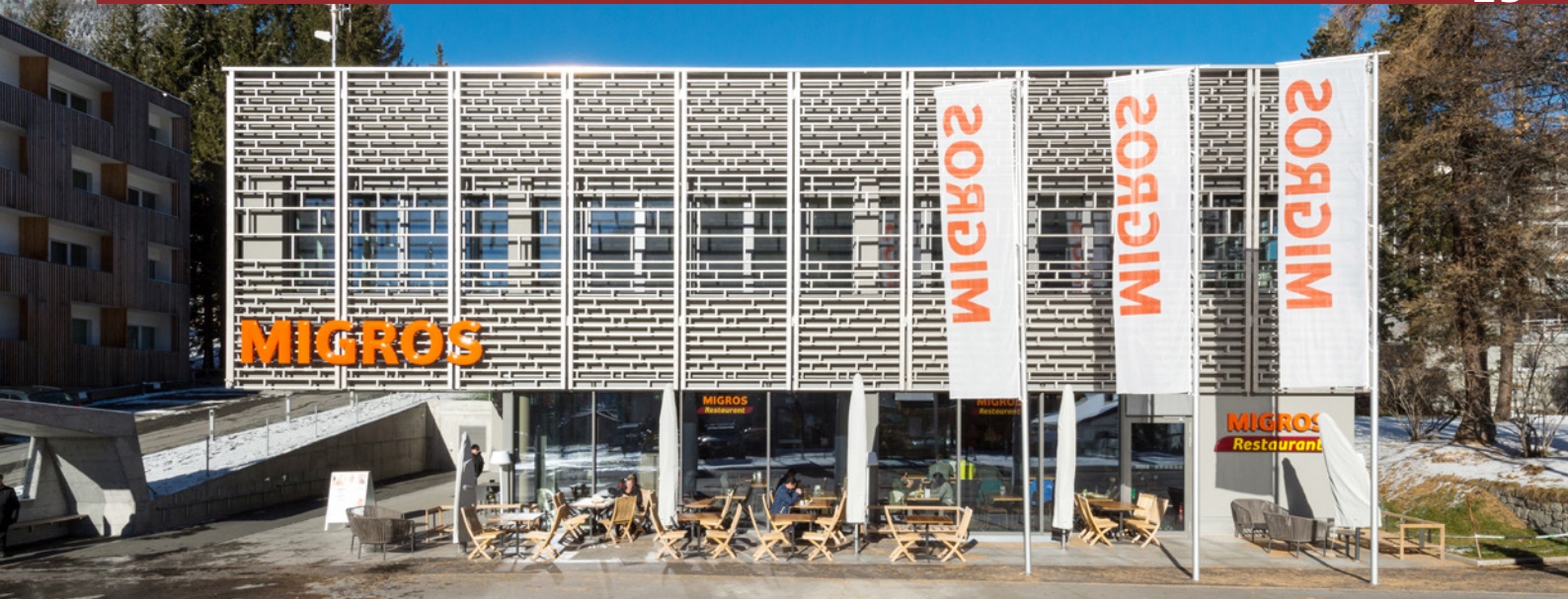
■ Der Migros Supermarkt mit m-electronic-Bereich und täglich geöffnetem Migros Restaurant mit Aussensitzplätzen an der Promenade.

Das Projekt zeichnet sich durch einen sehr niedrigen Energieverbrauch aus. Die Fassade mit den charakteristischen Veranden in massivem Holz lehnt sehr stark an die Fassadengestaltung historischer Gebäude sowie der bestehenden Gebäude an der Promenade an. Alleine für das Hotel wurden 215 m 3 heimisches Holz verbaut. Dessen Fassadenfläche beträgt 2560 m 2 und diejenige des Daches 2450 m 2 . Dazu kommen die Fassaden des Wohnbereichs und des Migros Supermarktes mit zusammen 2000 m 2 Fläche.