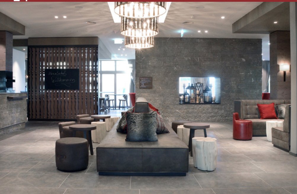
■ Das Ameron Swiss Mountain Hotel wurde im 4-Sterne+ Bereich errichtet. Bei der hochwertigen Einrichtung dominieren warme Naturtöne und natürliche Materialien wie Holz, Stein und Leder. Der Alpine Chic wird durch ein subtiles Lichtkonzept in Szene gesetzt.