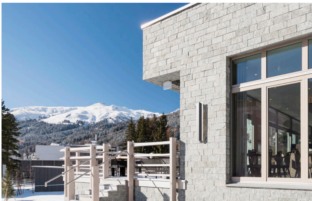
■ Vom Hotel wie auch von den Eigentumswohnungen geniesst man einen herrlichen Ausblick auf das hochalpine Panorama rund um die höchstgelegene Stadt Europas. (Bilder: zVg, Ameron Hotels)

Einen besonderen Fokus beim Ausbau legte die Migros Ostschweiz auf die Verwendung von materialökologisch sinnvollen Produkten, so wurden beispielsweise halogenfreie Kunststoffe bei den Elektroinstallationen und Dämmungsumhüllungen sowie emissionsarme Farben verwendet. Die Kühlräume und Kühlmöbel werden